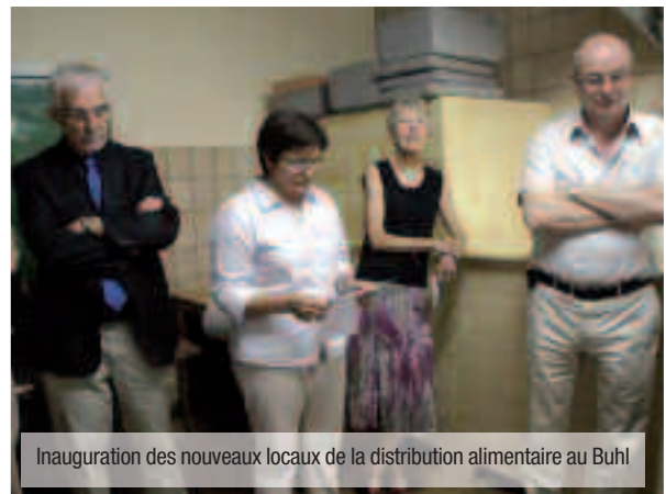
Inauguration des nouveaux locaux de la distribution alimentaire au Buhl

Récemment, la distribution alimentaire de Barr (antenne de la Banque Alimentaire de Strasbourg) a inauguré ses nouveaux locaux dans l'ancien internat des garçons au Buhl. Elle bénéficie maintenant de près de 120 m 2 pour accueillir dans les meilleures conditions possibles les quelques 140 bénéficiaires à Barr. La distribution alimentaire y dispose de plusieurs pièces où elle peut d'une part stocker les denrées alimentaires, d'autre part accueillir les demandeurs d'aide.